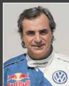
6. Carlos Sainz