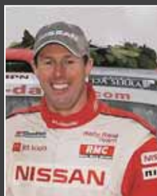
9. Colin McRae