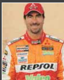
1. Luc Alphand