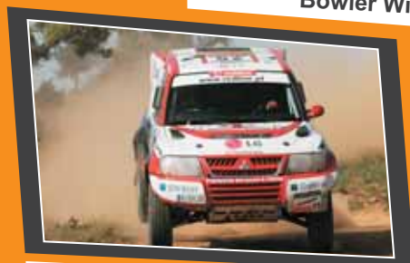
Mitsubishi Pajero DiD