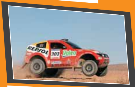
Mitsubishi Pajero EVO