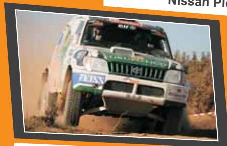
Toyota Land Cruiser