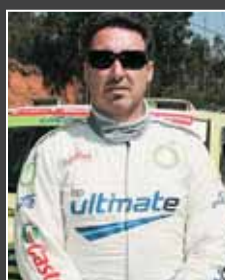
37. Nelson Clemente